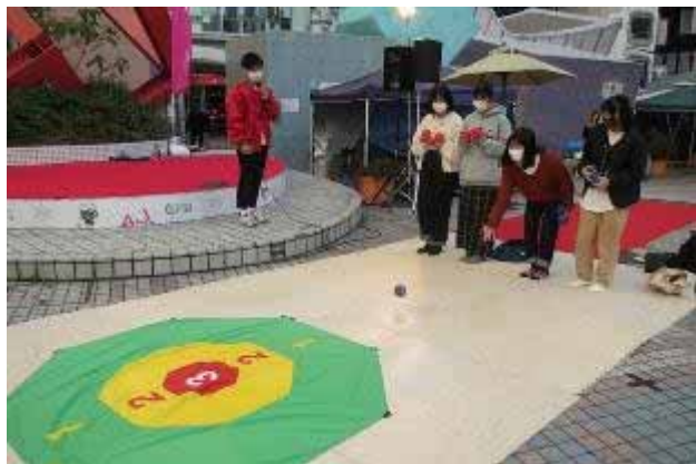
パラスポーツ・アクティビティ・ポッチャ