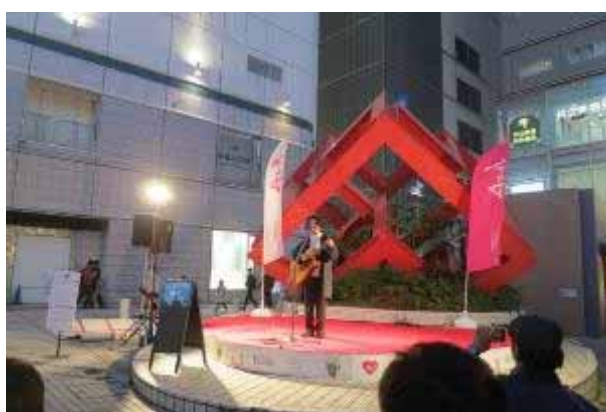
KEISUKE スペシャルライブ