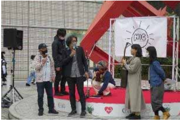
ステージの合間の講評

さて育成プログラムへエントリーしたアーティストのステージに入る。最後のシャーケン以外、新人と言える。それぞれのステージが終わるとベテラン組のアドバイスが入り真剣に聞き入る。みな10月の第1次イベントよりすごく進歩している。若さというものがその度合いが速い。特に4人の女性アーティストは、それぞれ自分の個性をよく活かした説得力のあるステージを披露し多くの人の足を止めた。