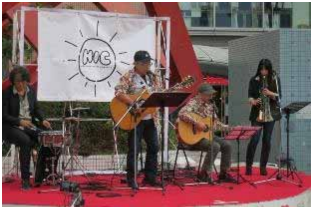
石澤ファンダメンタルバンド

昼の12時から始まり13組のアーティストのステージが続く長尺ライブ。前半はベテランアーティスト組だ。さすがそれぞれステージングは余裕の風、自分の個性をきちんと押さえ、アピールすべきフレーズは外へ向かってアピールする。丁寧に作りこまれ淘汰された表現だ。