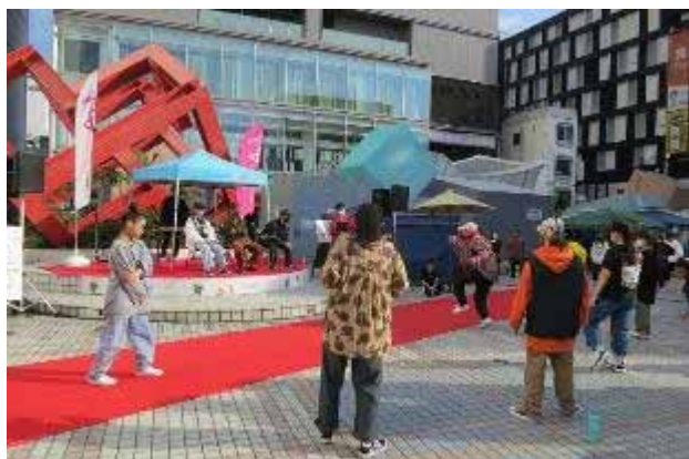
プレゼンテーション