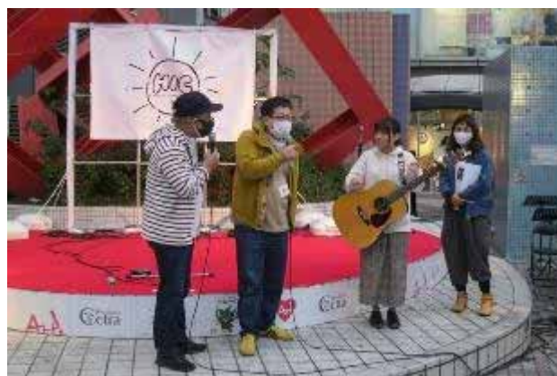
ベテラン組によるアドバイス