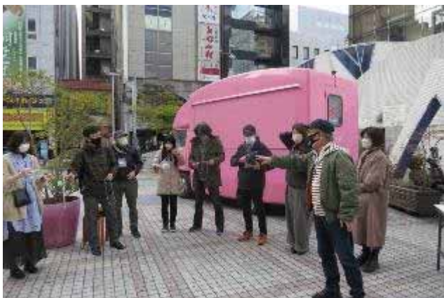
イベント前のミーティング：ベテラン組