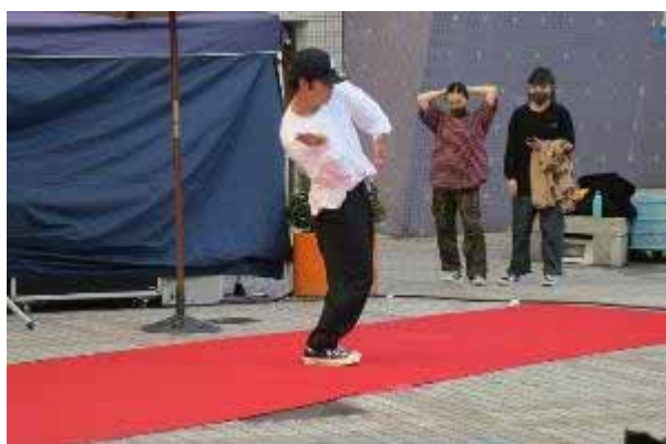
優勝者 ダイキのパフォーマンス