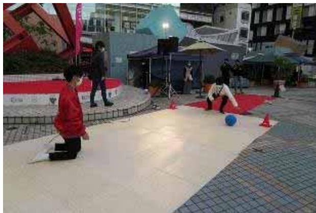
パラスポーツ・アクティビティ・ゴールボール

ダンスが続いたが次のプログラムはパラスポーツ・アクティビティ。アクティビティというからには、基本楽しむための活動だろう。一般社団法人 広島県障害者スポーツ協会の後援がついている。パラスポーツを健常者が楽しめるか？意外と楽しめるという分けた。初めにポッチャ、広場にいた高校生の女の子が参加。健常者は簡単に手を振ってボールを投げることができるが、障害のある方はそれがなかなか難しい…。次にゴールボール、音の出るボールを、目隠ししたキーパーに向けシュートする。いかにブロックが難しいか…。こちらは元気のいい男子の高校生が参加。パラスポーツを健常者が体験することは、自分がないものを思いやる…との、まあ「ダイバシティ」のメンタリティーかな、その気づきになる。今回は試験的にやったが、欲を言えば、広場内に複数ゲームコーナーを設け同時にプレイすれば、多くの人に参加でき、かつアーバンストリートイベントにふさわしいシーンが演出できるのではないかと思う。