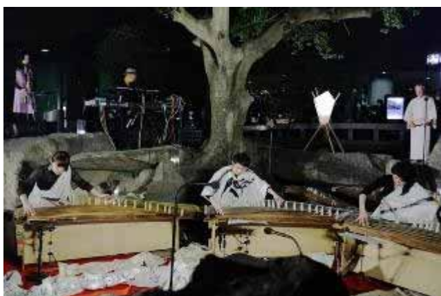
・The Koto Unit “Syasyaten”<箏・17 絃>