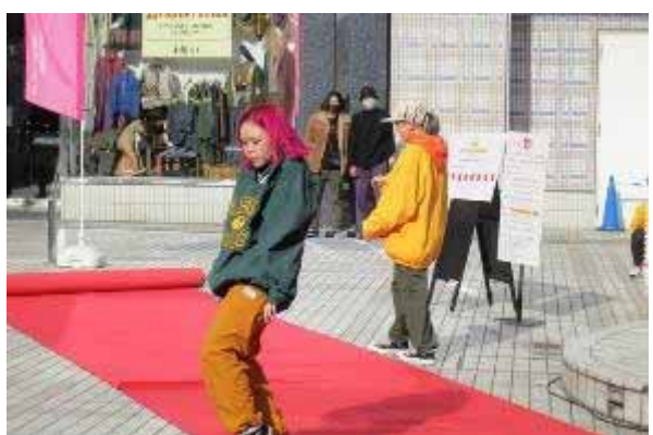
スタジオワンセルフ・ショーケース