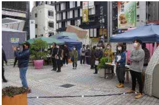
ステージを見守る出演・スタッフ兼ねるHIC面々

また観客について言うと昼から夕方まで最後まで熱心に聴き入る人もおり、年配の方が若いアーティストを応援する光景が見られた。こういったファンがクラスターとなってこのサークル活動を伝播していけばいいなと思った。