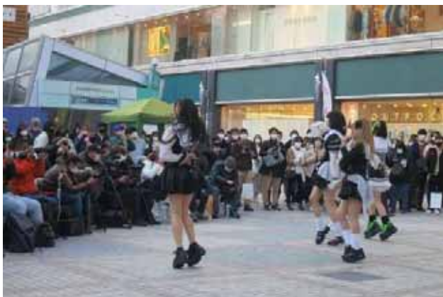
「サークルクラッシャー」