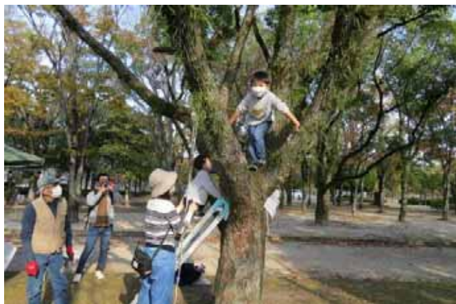
この樹って木登りに最適！