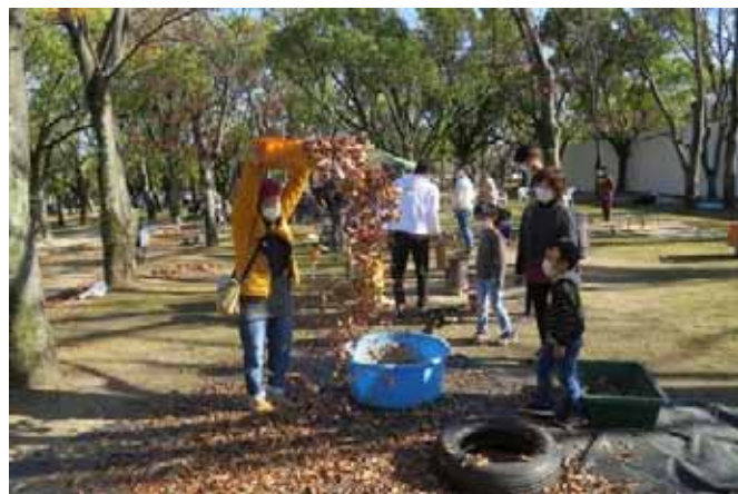
わーい！枯葉シャワー！