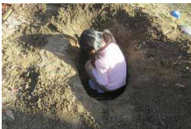
そして穴の中が私の居場所！