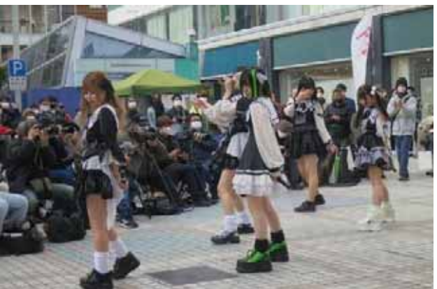
「サークルクラッシャー」