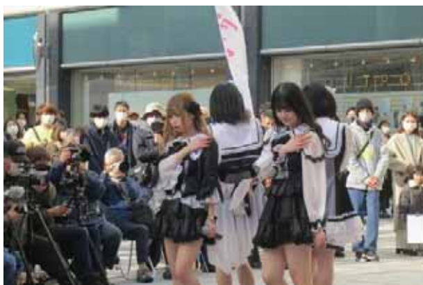
「サークルクラッシャー」