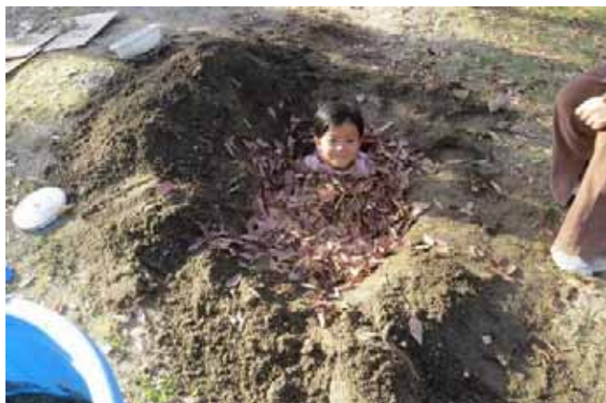
そうだ枯葉を入れて安心！安心！あんたが今日の遊び大賞！