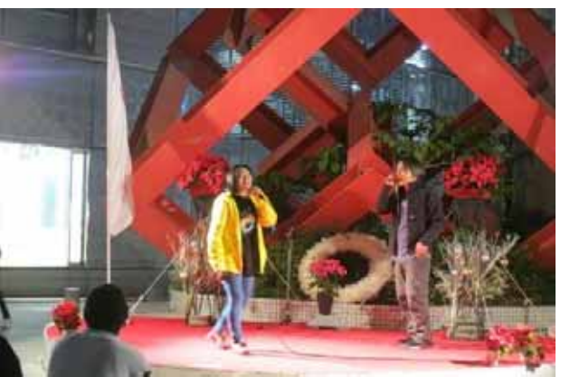
シャーケンと仲間たち