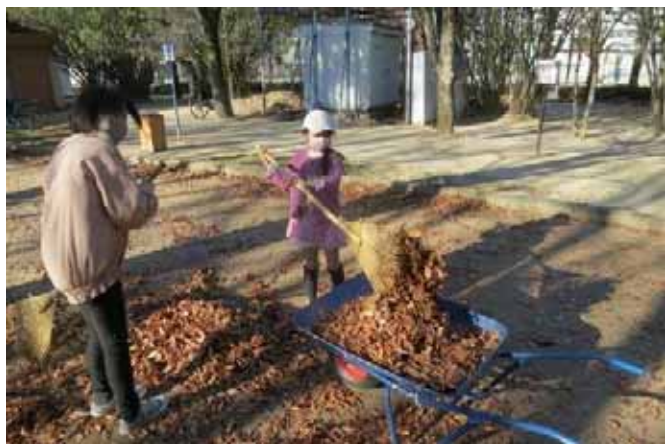
私は枯葉を集めるのた！