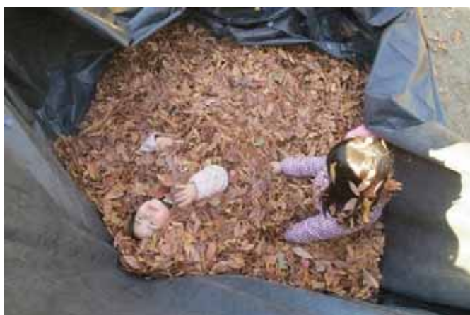
枯葉プールでくつろごう！