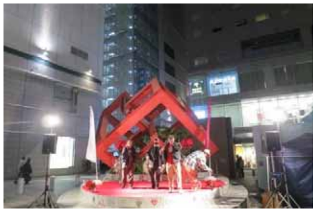
シャーケンと仲間たち