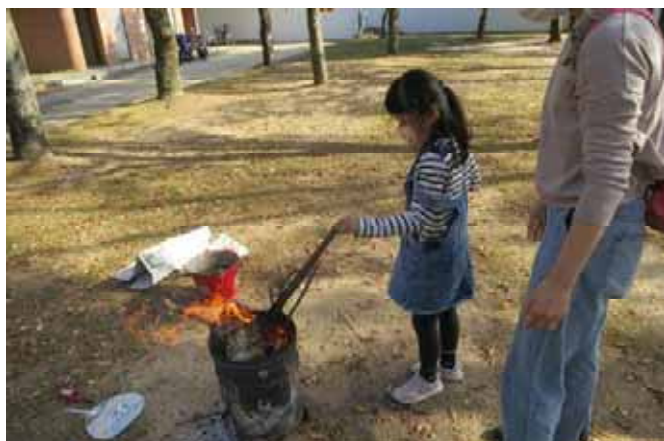
火の起こし方って!

サッカースタジアム建設でこの場所に移って2回目。木登りのために丁度いい樹があり仕かける。樹の上から見たらなかなかいいシーン。定番の「ダルマさんころんだ」もいい。きれいにまん丸の泥団子の作品はボランティアの子が作った、しかし何といても昨日の「あそび大賞」は、わき目もふらずただただ地面を掘り続け、大きな穴を作った一人の女の子に決定!!(レポート:石丸)