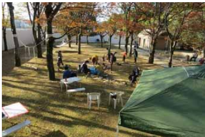
のどかな自遊ひろば、のどかな日曜日！