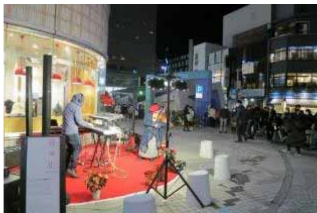
パルコ公開空地・市道側へのイベント進出