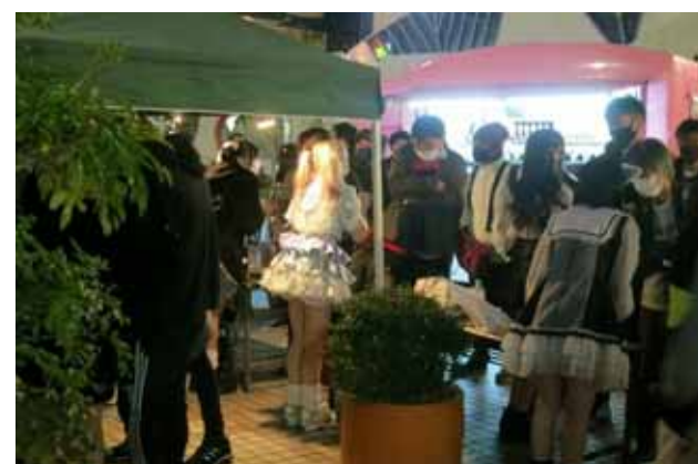
アイドル出番後の特典会