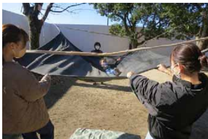
ボランティアのお姉さん！もっと揺らして！