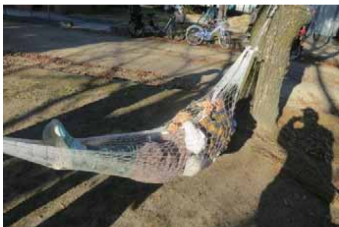
二人仲良くハンモックミノムシ