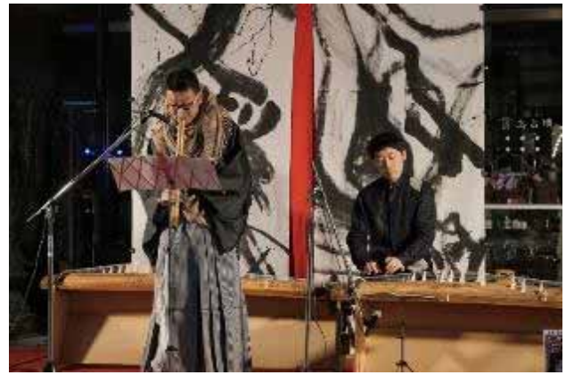
流川テラスストリートで行われた、広島伝芸「辻楽」の様子