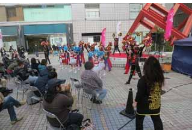
チャーリーダンススタジオ・ダンスステージ