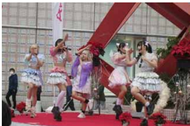
「絶望のポメラニアン」