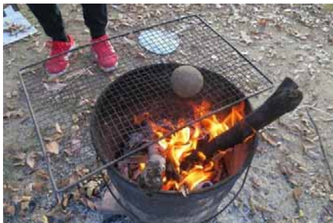
まん丸泥団子を陶器にみたくに焼こう!