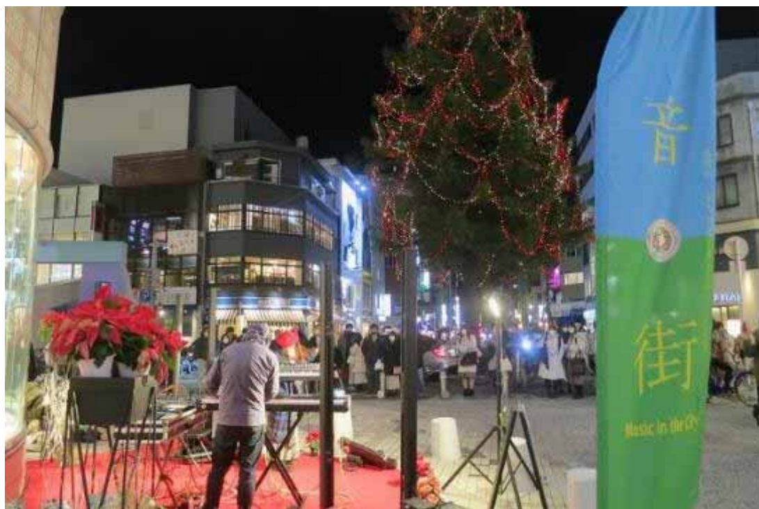
パルコ公開空地と並木通りのエントランスとの関係