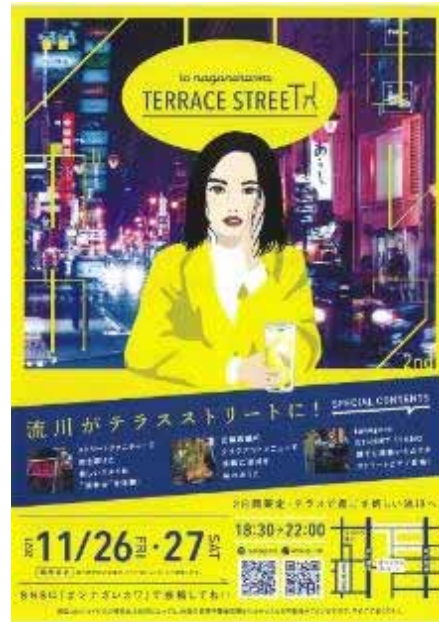
「流川テラスストリート」チラシ

主催：NPO 法人セトラひろしま・日本伝統文化振興プラットフォーム「広島伝芸」 共催（連携団体）：まちなか・西国街道推進協議会 協力：中区地域起こし推進課、広島市文化協会、広島市中央部商店街振興組合連合会 ＊令和3年度 区の魅力と活力向上推進事業補助金対象事業