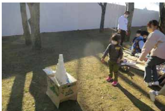
新手の遊び、紙コップピラミッドを紙飛行機で崩そう！