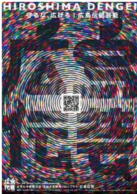
広島伝芸 HP URL QR コードポスター