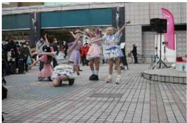
「絶望のポメラニアン」