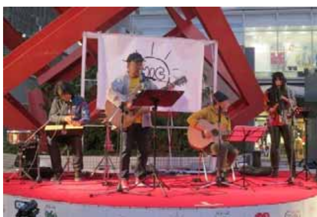
石澤ファンダメンタルバンド