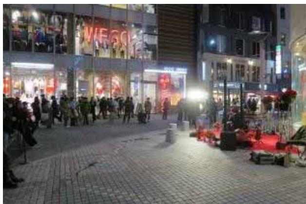
パルコ公開空地と市道の関係