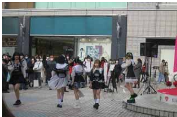
「サークルクラッシャー」