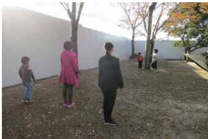
定番の「だるまさんがころんだ！」