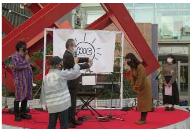
選定曲(1)うずら (作者・歌唱/演奏) 選定書授与