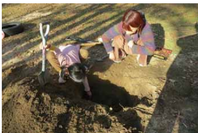
私は「穴を掘るのだ！」